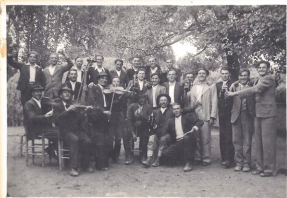
Mulatós csoportkép. (1940-es évek.)