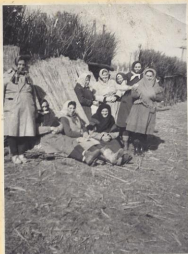
„Dédi a TSZ-ben Kolhozban” Női dolgozók a mai TSZ-szárító mögött. (1970 körül.)