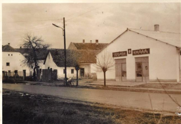
A Pintér-féle vegyesbolt, Zeleni Gyula volt péksége és a felvásárlótelep. Háttérben a Népház teteje látszik. (1970-es évek.)