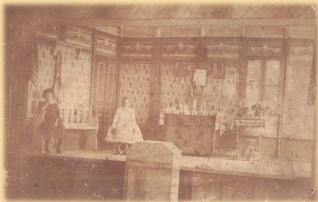
„Dunafalva Színház. Poros dédi fehérben” (1930 körül.)