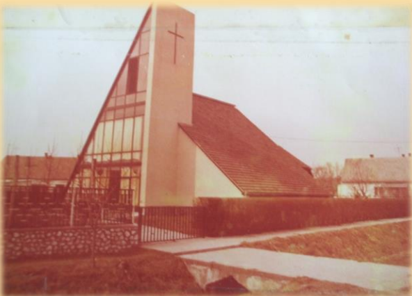
Hitélet. A helyi hívek aktív segítségével készült új dunafalvi templom. (1980.)