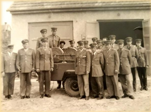
Az Önkéntes Tűzoltó Egyesület. (1970 körül.)